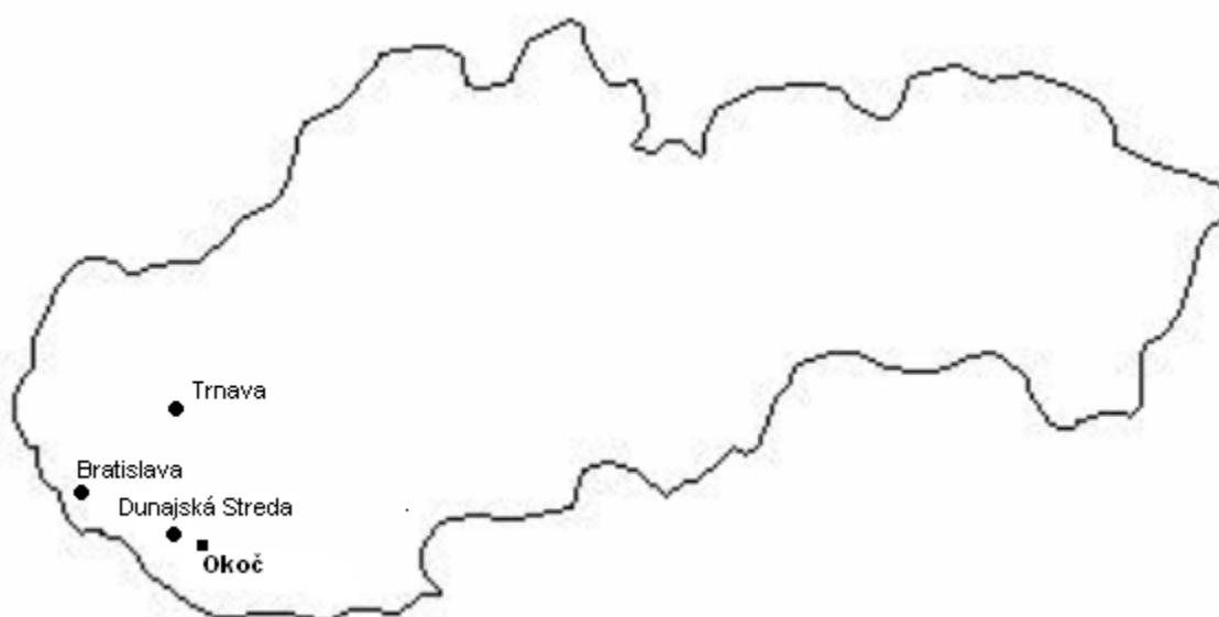
Mapa 1: Poloha obce Okoč na Slovensku vo vzťahu k hlavnému mestu, krajskému centru a okresnému mestu

Stav k 1.12.2014